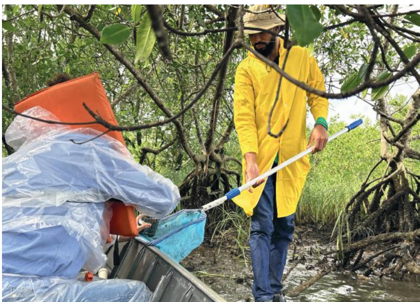
Equipe técnica ambiental trabalhando na Campanha de Monitoramento de Fauna. Imagem: CSPG.

Todas ações têm acompanhamento de profissionais como biólogos e oceanógrafos, especialistas habilitados para validar as atividades em execução, bem como engenheiros ambientais que acompanham todo o processo.