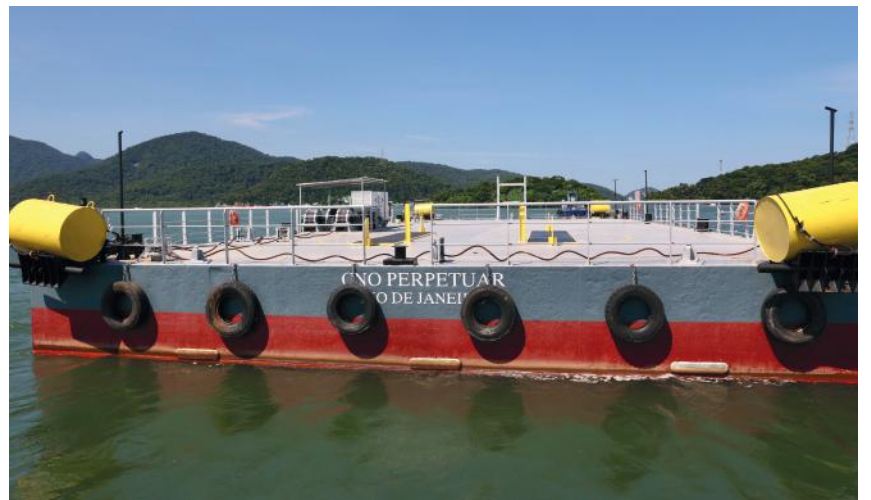
Balsa de apoio marítimo "Perpetuar".