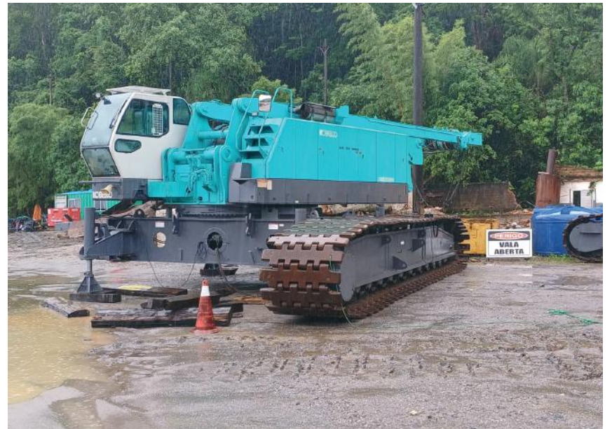
Parte do guindaste CKE2500G-2.