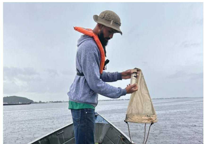
Atividade realizada durante a Campanha de Monitoramento de Fauna.