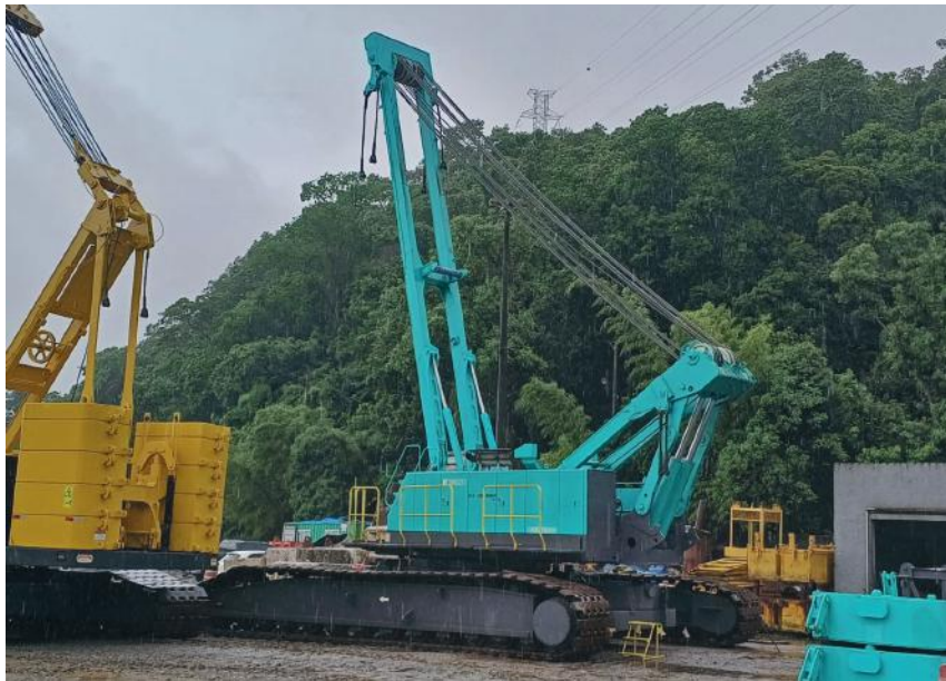
Parte do guindaste de 250 toneladas.

O Canteiro Industrial segue com intensa movimentação em Guaratuba. O guindaste de 250 toneladas, o CKE2500G-2, chegou no litoral paranaense. Dezesesseis (16) carretas, saindo de Santa Catarina, fizeram o transporte de partes do maquinário. Após a montagem completa, o equipamento de alta robustez ficará em uma das balsas de apoio marítimo para o deslocamento e distribuição das vigas de concreto nos pilares da ponte no trecho de 1.244km.