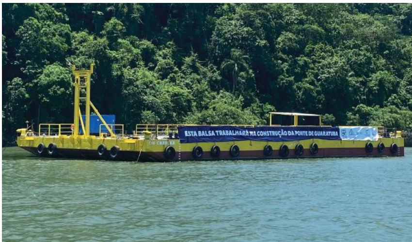
Balsa de apoio marítimo "Crescer".

As embarcações, têm dimensão de 38,25m x 18m, com aproximadamente 440 toneladas, que serão empregadas no apoio marítimo, possuem capacidade de manobra aprimorada para seu posicionamento próximo a cada estrutura a ser atendida.